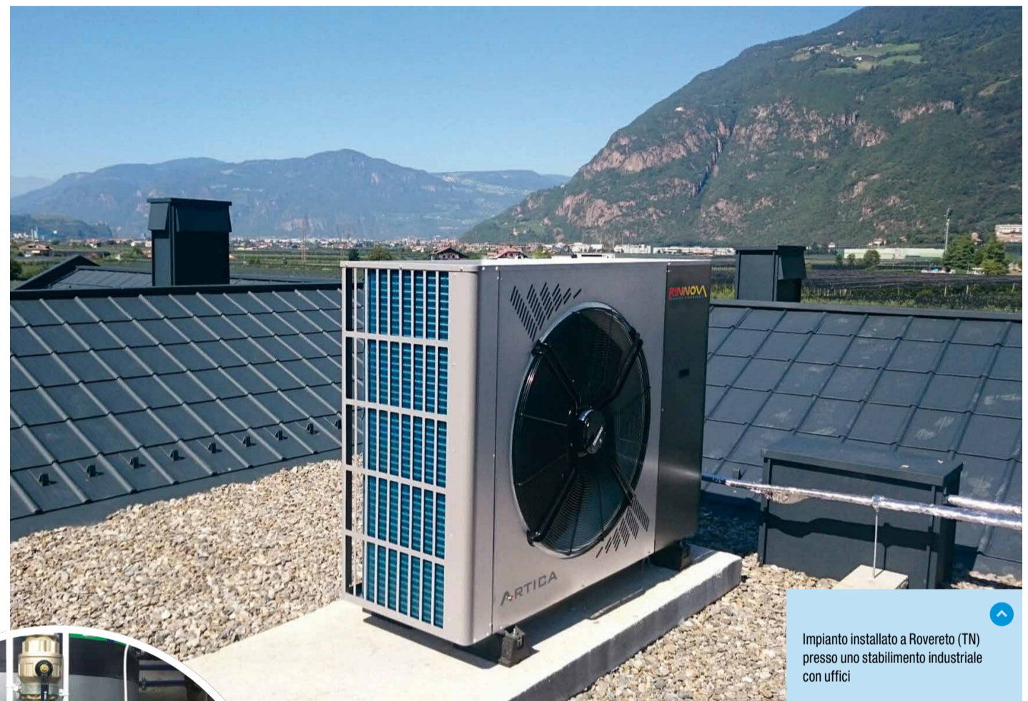
Impianto installato a Rovereto (TN) presso uno stabilimento industriale con uffici

sensibilmente i costi di bolletta, fa bene all'ambiente.